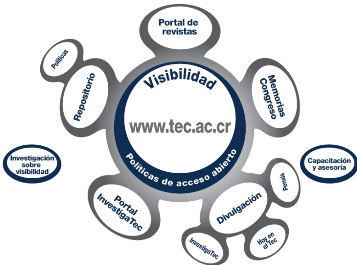
Figura 1. Sistema integral de visibilidad institucional del TEC