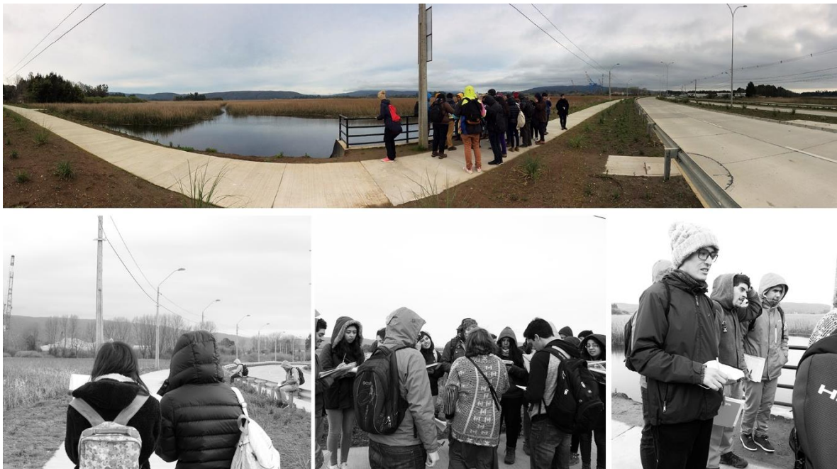
Fig. 1 sector Las Mulatas.

costanera diseñada sobre un humedal, no obstante, la vía peatonal no cuenta con instalaciones que permitan convertirla en un paseo para el uso recreativo de las personas. Figura N°1, N°2 y N°3.