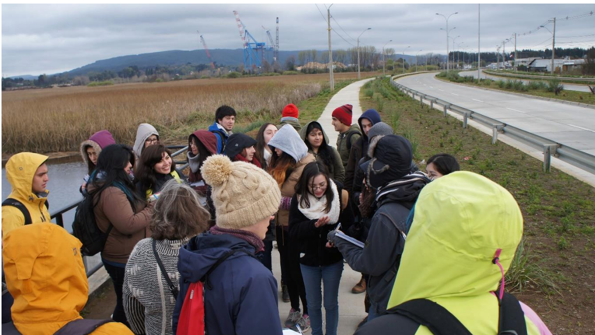
Fig. 2