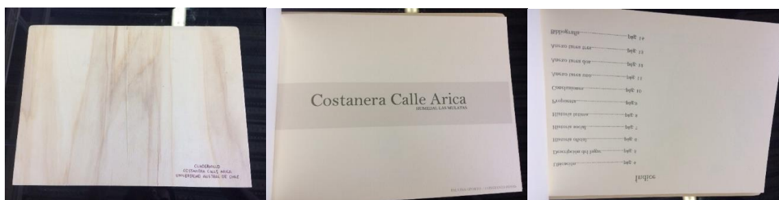
Fig. 7 Bitácora de la memoria del lugar