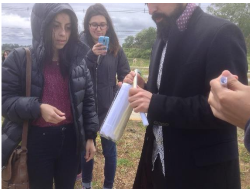
Fig. 6 Contenedor de las ideas de proyectos

Hacia fines de 2016 los estudiantes realizaron propuestas para transformar el lugar, en uno que fuera memorable. Las propuestas fueron puestas en una botella, siguiendo la metáfora del naufragio, que guarda la esperanza en una botella para ser rescatada del peso del olvido. Figura N°6. El trabajo final se registró en un cuaderno empastado por los estudiantes, conteniendo todo el proceso de territorialización de la memoria del lugar que realizaron en el año. Figura N°7 (trabajo de las estudiantes Paulina Oporto y Constanza Rosas).