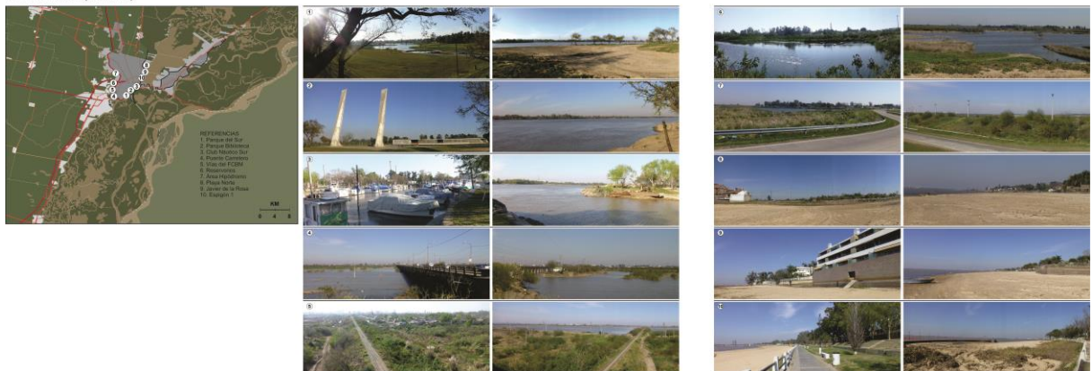
Fig. 3. Relevamiento fotográfico de los bordes Este (Laguna Setúbal) y Oeste (Río Salado) de la ciudad de Santa Fe. El borde este está formalizado por la Costanera, mientras el borde oeste por la avenida de Circunvalación y un sistema de reservorios pluviales en desarrollo. Producción propia.