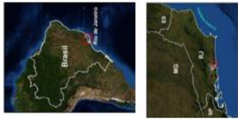
Fig. 1: Proyectos para las aguas urbanas de Niterói. (Adaptado de PMN, 2015)