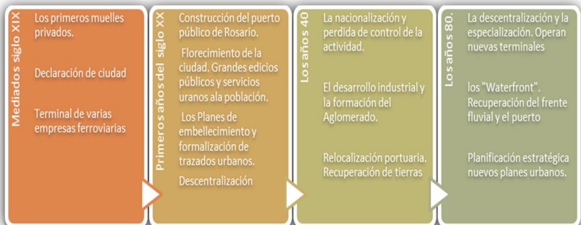
Fig.2. Distintos momentos en la evolución de la relación Ciudad Puerto en el caso de Rosario.

Rosario, reconocida como un claro caso de las llamadas ciudades- puertos, convoca a la reflexión -en esta oportunidad- acerca de cómo se da esa relación en el tiempo, atendiendo no sólo al planteo de vínculos entre el área portuaria con la urbanización y el medio natural, sino además incorporando al contexto de referencias los cambios que hacen al modelo de desarrollo y gestión. Se caracterizan cuatro fases o etapas en su evolución (Fig. 2):