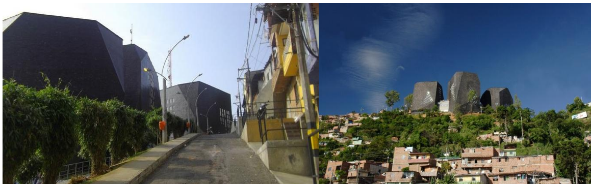
Giancarlo Mazzanti. Parque Biblioteca España, Medellín, 2005.

que su singular implantación en la escarpada pendiente de la ladera, conjuntamente con su particular volumetría, ha provocado en los vecinos un enorme impacto visual y de identificación como mojón de su barrio. El conjunto se ha convertido en un mirador privilegiado del valle, potenciando su función como lugar de reunión y encuentro y transformándose en un punto de referencia de la zona.