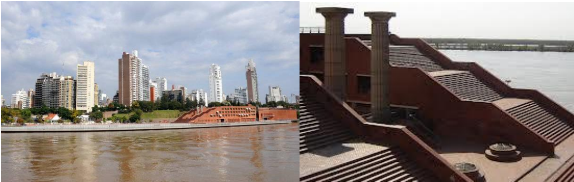
Bohigas-Martorell-Mackay. Parque de España, Rosario, 1979-1992.

recreativos e higienistas propios del siglo XIX, pasando por los programas culturales de los museos y zoológicos, hasta concluir en el proyecto del Parque de España. Entre todas las operaciones arquitectónicas y urbanísticas proyectadas para dar respuesta a un extenso y complejo programa, destacaron la de posicionar el volumen edilicio que aloja las actividades específicas, entre las cotas inferior y superior de la abrupta barranca, de manera que su cubierta se constituyera en un espacio de uso público a modo de balcón hacia el río. En tal sentido explicaron que la iniciativa surgió con el fin de reconvertir ese sector de las barrancas del Paraná, para la recuperación del acceso público a la costa desde el área céntrica de la ciudad, constituyéndose en punto de partida para posteriores proyectos de recuperación de la ribera.