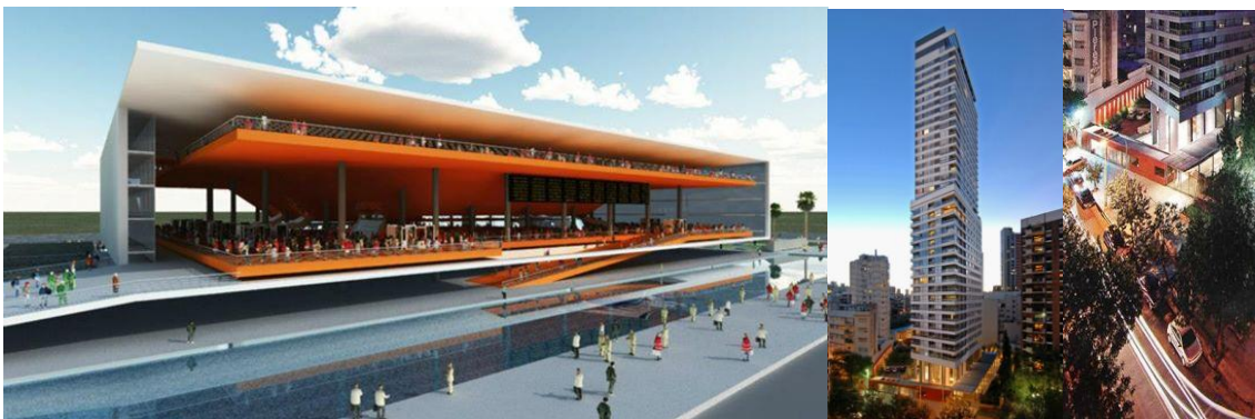
NMD | Nómadas. Estadio Marinos de Anzóategui, Puerto La Cruz, 2009. Estudio Aisenson. Torre Bellini, Bs. As., 2004.

b- Estudio Aisenson (Aisenson | Pujals | Hojman | Pschepiurca | Fizelew): Torre Bellini, Buenos Aires (2006) 16 . Lo que hace particularmente valioso a este edificio de propiedad horizontal es su inserción urbana a nivel peatonal, recediendo su línea de edificación en el lugar estratégico de la esquina. De este modo se logra descomprimir visual y funcionalmente la estrecha calle sobre la que se ubica, en consonancia con la edificación de la vereda opuesta, las Torres Las Plazas proyectadas por el mismo estudio en 1994.