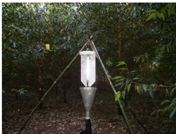
Figura 1. Armadilha luminosa em plantio de E. grandis x E. urophylla em São Francisco de Assis, RS, Brasil, 2009.

Figure 1. Light trap in planting E. grandis x E. urophylla in São Francisco de Assis, RS, Brazil, 2009.