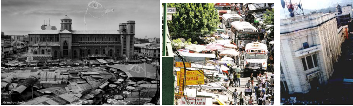
FIG. 3, 4,5 – las vulnerabilidades del CHSS: Comercio Informal, Caos vehicular e Polución visual.