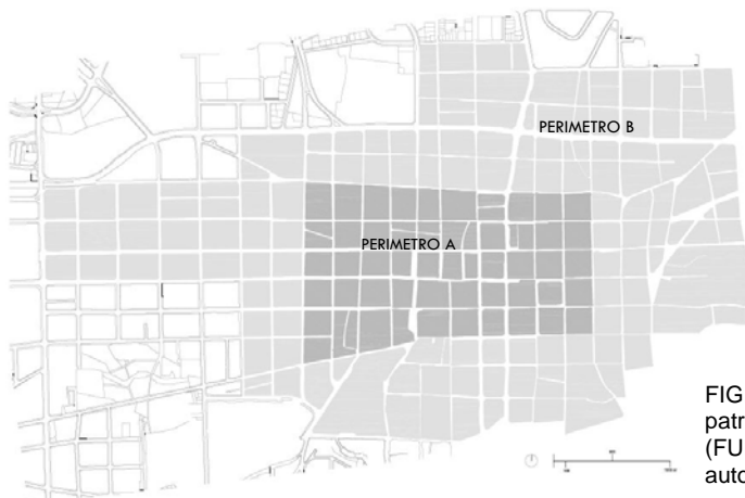
FIG. 2 – Perímetros del CHSS para reconocimiento patrimonial.