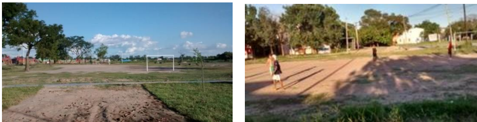
Fig 13. Potreros en EVP de AUDC Golf Club.

A las falencias de diseño y a las carencias de dotaciones se suma la degradación e inutilización de bancos y juegos, la falta de iluminación por rotura de luminarias, etc. como resultado del escaso mantenimiento y de acciones vandálicas. La inexistencia de agentes de control, la práctica de actitudes incívicas como la circulación de motos en las sendas peatonales, genera situaciones de peligro para niños y ancianos. En este contexto el EP deja de ser un espacio dignificante y democrático, se convierte en un espacio de reproducción de desigualdades e inequidades donde una importante parte de la población, incluso de un mismo barrio, queda excluida de la posibilidad de disfrutarlo. La reducción del número de personas que los usan, es una contribución más a su progresiva estigmatización y abandono y esto, a su deterioro. Se transforman en espacios que en lugar de atraer, expulsan o se intentan evitar. Ello explica los grados de abandono y desuso encontrados en determinados casos.