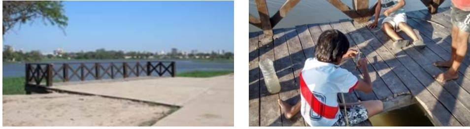
Fig. 12. Muelles y niños pescando a orillas del Parque del B. ° Nuevo Don Bosco.

En cuanto a las dotaciones deportivas, en casi todos los espacios observados son una constante las canchas de futbol o el espacio libre donde éstas son improvisadas. Si bien estos espacios dan respuesta a una demanda popular altamente generalizada y el futbol es un poderoso medio de interacción social, no existen opciones para la práctica de otros deportes que podrían operar en igual sentido. La falta de alternativas reduce la promoción del espacio público al género masculino y en particular a determinada franja etaria. De acuerdo a las características socioculturales de los barrios en cuestión, el futbol es un deporte masculino y en el uso de las canchas se impone la decisión de los más fuertes. De este modo, las posibilidades de juego infantil dependen de la ocupación o no que los adolescentes o adultos del barrio hagan de estos espacios.