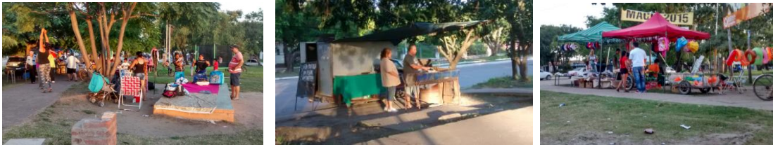
Fig. 14. Comercio informal en la Plaza Del Ejército Argentino. Fotos: E. Ledesma}

Como reflexión final podemos indicar que las plazas y parques estudiados en la AUDC Golf Club, presentan las características de las unidades socioespaciales homogéneas que integran. En general, en lugar de funcionar como espacios de articulación y de atracción entre distintos barrios, son espacios usados fundamentalmente por sus propios habitantes. En ellos se replican las diferenciaciones sociales y se cristalizan las desigualdades que caracterizan este tipo de áreas. Sin embargo, es posible destacar dos cuestiones importantes: intervenciones como la desarrollada en el Parque Urbano Laguna Prosperidad demuestran el enorme potencial de los espacios públicos para producir cambios cuando hay proyectos que van más allá de un plan sectorial. En el extremo opuesto, es posible constatar la capacidad de congregación de vecinos diferentes que tiene un espacio público bien localizado, visible y con buena accesibilidad aún cuando carezca de las más elementales dotaciones como la Plaza del Ejército.