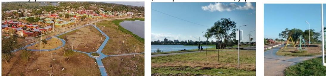
Fig 10 y 11. Parque Urbano Laguna Prosperidad. Imagen aérea de Fb: Resistencia desde el aire; y Fotos: E. Ledesma,03/2015