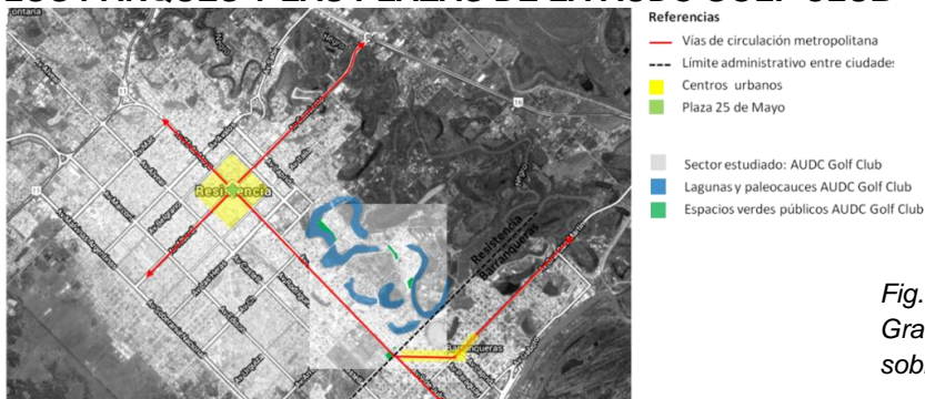
Fig. 1 AUDC Golf Club en relación al Gran Resistencia Elaboración propia sobre imágenes de Google Maps