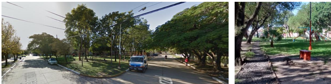
Fig 6 y 7 Plazoleta Barrio Mercantil. Imagen Izq: captura de googlestreetview.com Dcha: Foto de E. Ledesma 09/2014

de una de sus calles laterales (la que linda con la manzana vallada) utilizada para depósito de residuos por parte de los vecinos.