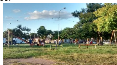
Fig 3, 4 y 5. Plaza del Ejercito Argentino . 03/2015