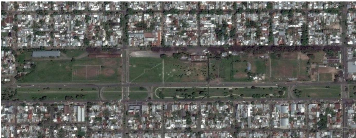
Fig. 2. Meridiano V. El FF.CC. en desuso y el vacío.

El barrio Meridiano V posee características particulares y distintivas. El Ferrocarril en una situación inédita para la Ciudad, puesto que el servicio que prestaba era pasante y no terminal (el modo frecuente en el que el ciudadano platense reconoce al ferrocarril), tras el cierre del ramal, ha dejado una impronta muy fuerte en la cual la historia se hace presente a cada paso; de esta manera, el habitante del barrio se identifica con el mismo, siente pertenecer y se apropia de los espacios públicos de un modo único y personal. Esta apropiación se manifiesta, por ejemplo, en la reutilización del edificio de la vieja Estación como Centro Cultural y su vacío alledaño como un espacio público de eventos; en el uso de viejos galpones como talleres de arte, en un conjunto creciente de bares de espectáculos, etc, estableciendo así un circuito y definiendo al barrio con un claro perfil cultural. Casualidad o causalidad, pero éste es, en definitiva, el asiento final y quizá el más apropiado, para la "Fiesta del alcaucil".