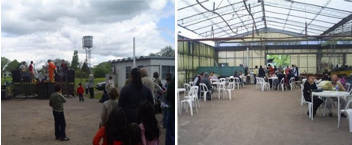
Fig. 1. Año 2007. "Primera fiesta del alcaucil", aún sin localización definitiva.

El barrio Meridiano V posee características particulares y distintivas. El Ferrocarril en una situación inédita para la Ciudad, puesto que el servicio que prestaba era pasante y no terminal (el modo frecuente en el que el ciudadano platense reconoce al ferrocarril), tras el cierre del ramal, ha dejado una impronta muy fuerte en la cual la historia se hace presente a cada paso; de esta manera, el habitante del barrio se identifica con el mismo, siente pertenecer y se apropia de los espacios públicos de un modo único y personal. Esta apropiación se manifiesta, por ejemplo, en la reutilización del edificio de la vieja Estación como Centro Cultural y su vacío alledaño como un espacio público de eventos; en el uso de viejos galpones como talleres de arte, en un conjunto creciente de bares de espectáculos, etc, estableciendo así un circuito y definiendo al barrio con un claro perfil cultural. Casualidad o causalidad, pero éste es, en definitiva, el asiento final y quizá el más apropiado, para la "Fiesta del alcaucil".