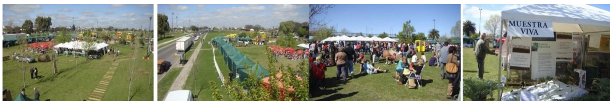
Fig. 6. Año 2014. El espacio urbano intervenido, el proyecto en uso.

Las respuestas normalmente están dadas en la densificación y el aprovechamiento más efectivo del suelo urbano, el desarrollo armónico de áreas consolidadas y equipadas en desmedro de la suburbanización, la generación de nuevas centralidades que propongan un espacio territorial homogéneo, etc.; en definitiva, como señalara Marcos Winograd, la “arquitectura de la ciudad” y en un nivel superior, el “hábitat”, entendido como “la interacción de las actividades realizadas por los hombres en un proceso de conformación del espacio”. En consecuencia, todos estos conceptos se encuentran comprendidos en el proyecto, señalando como particularidad en este caso, que la intervención en el vacío urbano de Meridiano V promueve proyectualmente la resolución de la contradicción entre el centro y la periferia, cosiendo aquello que hoy se encuentra fragmentado.