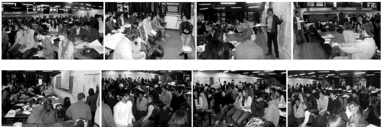
Figura 3 Taller vertical de Arquitectura N° 1 Sbarra Morano Cueto Rúa. Fotos varias.

En muchos casos es difícil, casi imposible, separar la imagen del sujeto alumno y la de su objeto producido en el proyecto; hay un punto del desarrollo del proceso creativo, que el objeto creado toma cuerpo, toma protagonismo, dejando al sujeto del conocimiento de lado. Creemos que cualquier apunte para una didáctica del proyecto de Arquitectura deberá incorporar esta problemática: la interferencia que crea en todo momento del proceso la presencia de ese objeto, que es la forma , la imagen del pensamiento y hacer del alumno. Con referencia a esta problemática, que es la de la relación objeto-sujeto , la deberíamos llevar hacia una dimensión que involucre también binomios como Naturaleza-abstracción, crudo-cocido, 21 blando-duro y la relación creativa que se establecerá entre el alumno creador, arquitecto con su objeto y con su docente que no es más, en términos de Sócrates, que el Partero de esa criatura que es el proyecto.