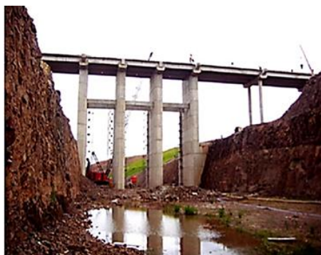
Figura 1: Represa Yacyretá, Arroyo Aguapey (Paraguay)

Sobre la base de la metodología internacional, se ha instrumentado la factibilidad y calibrado de la misma en el contexto Argentino, denominándose a su aplicación CoPsoQ, FAU-UNLP. Esta nueva línea de investigación en la Unidad Académica, se inicia con el PID/U003 (2006 – 2009) Contribución del sistema de control de factores psicosociales a la optimización de la organización en obras de construcción , y amplía su base de información por medio de nuevas evaluaciones obtenidas a través del Proyecto Cód.11/U127 (2012/2014) Factores psicosociales en la optimización laboral de la construcción. Apertura hacia una diversidad de sistemas jurídico – económicos productivos . Generada la línea de investigación fueron inventariadas obras pertenecientes a dos grupos tipológicos: Edificios en Propiedad Horizontal y Obras de Infraestructura. En cada experiencia se efectuaron evaluaciones en centros laborales correspondientes a cada tipología seleccionada. En la primera indagación se evalúa un PH Urbano(2008) ubicado en la ciudad de La Plata, Provincia de Bs As y las Obras Complementarias de protección del valle del arroyo Aguapey (2008) de la Represa Yacyretá, Paraguay, Figura 1. En una segunda aplicación del método se intervino en la Provincia de Bs As, sobre un PH Urbano-Secuencial (2013-2014), de la ciudad de La Plata y en la Obra de Infraestructura – Ampliación de la Red de Desagües Cloacales (2013-2014), ubicada en la ciudad de Guernica, Figura 2.