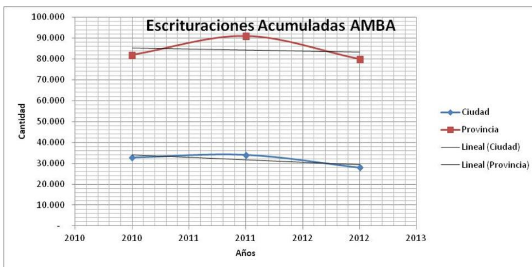
Figura 6– Línea de Tendencia estimada a partir de una regresión línea de los últimos tres años.