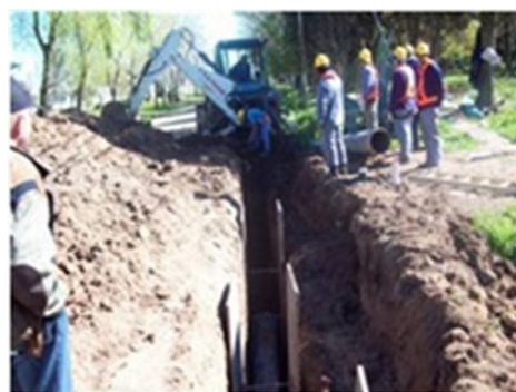
Figura 2: Ampliación red de desagües Guernica, Bs. As.