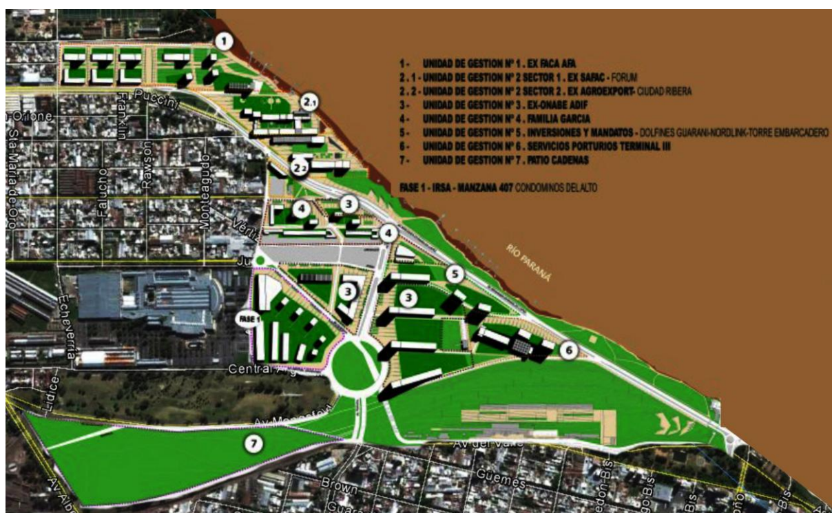
Fig.2: Proyecto Urbano Puerto Norte en Rosario.

En el proceso de planificación de Rosario, se ha desarrollado una intensa y constante gestión de suelo, acompañada de una planificación urbanística de las áreas de nuevo desarrollo. Ese proceso ha dado como resultado una de las transformaciones más trascendentales: la reconversión del antiguo puerto como operación apuntalada en el recupero del patrimonio productivo, industrial o ferroviario que incorpora a la ciudad áreas e instalaciones desafectadas de su uso original y transformadas en espacios vitales. Por normativa establecida por la Secretaría de Planeamiento de Rosario para toda el área de Puerto Norte, se debe garantizar el acceso al río para el uso público y conservar su patrimonio edilicio, aunque albergue nuevas funciones (Levin, 2011).