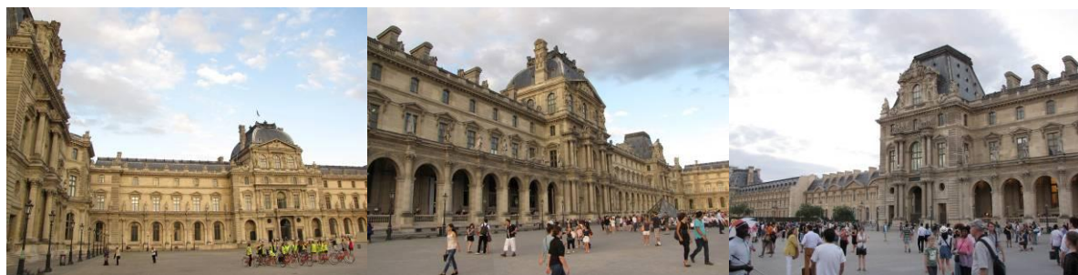
Fig. 4 Vistas do Museu do Louvre sem a Pirâmide na 'Cour Napoléon'

Dos 128 respondentes, 40 visitaram o Museu do Louvre antes e depois da construção da Pirâmide; destes, 31 (de 104 - 29,8%) são brasileiros, 7 (de 20 - 35%) são franceses, e 2 (de 4 – 50%) são de outras nacionalidades. A preferência pelo Museu do Louvre com a Pirâmide é largamente superior (87,5% - 35 de 40) à preferência pelo Museu sem a Pirâmide (12,5% - 5 de 40) (Fig. 4), tanto na amostra total quanto em cada um das amostras individuais, com a totalidade dos franceses (7) e de outras nacionalidades (2) preferindo o Museu com a Pirâmide (Tabela 9). Dentre as justificativas pela preferência pelo Museu do Louvre com a Pirâmide estão aquelas relacionadas à estética e à funcionalidade do Museu, tais como: - 'Espaço do acesso pela pirâmide melhorou a circulação interna e percursos.' (1 brasileiro) - 'Sempre prefiro a permanência da arquitetura original, sem interferência, mas a do Louvre tenho que admitir que gostei porque deu uma personalidade que o Museu não tinha. Além disso, ele ficou com mais funcionalidade interna que apenas com a arquitetura original não era possível...' (1 brasileiro) - 'A pirâmide transparente é o elemento adequado para desmontar a severidade do pátio ancestral sem obstruir sua fruição. Pode-se dizer que sua proposta é uma das melhores sínteses arquitetônicas de Paris.' (1 brasileiro).